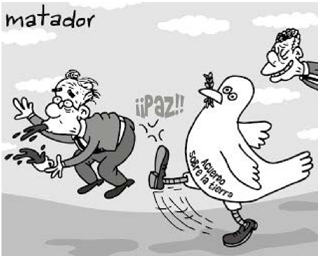
Caricatura