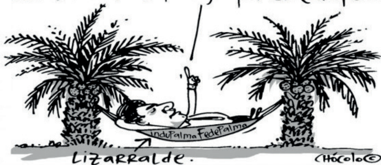
Caricatura Chócolo EL ESPECTADOR