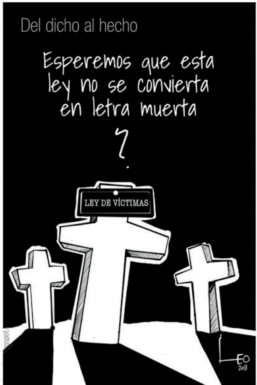
Caricatura Leo Año 2011 Revista SEMANA.com

En El Espectador , Chócolo ha sido el más puntilloso con el tema mostrando los intereses políticos de todos los bandos frente a la Ley. En una pieza, Uribe Vélez le reclama al gobierno de Santos haberse dejado despojar de 40 kilómetros de mar, y este le recuerda que en los ocho años que gobernó se despojaron millones de hectáreas. La de mayor carga simbólica es la titulada “La efectividad del mapa de la restitución” donde aparecen marcadas con cruces las zonas restituidas en el mapa de Colombia. Chócolo, igualmente corrosivo, recuerda que “la tierra es para el que la trafica” con la imagen de una calavera, y la misma calavera señala en el tablero del aula de clases: “Operaciones de restitución de tierras”, y un niño pregunta: “¿Cuántos homicidios suman una masacre?”, denunciando con sus caricaturas las consecuencias fatales de la restitución para muchos campesinos. Betto, el caricaturista más premiado del medio, utiliza reiteradamente el símbolo de la paloma (con azadón), en particular cuando se firmó el primer punto del acuerdo de paz en La Habana.