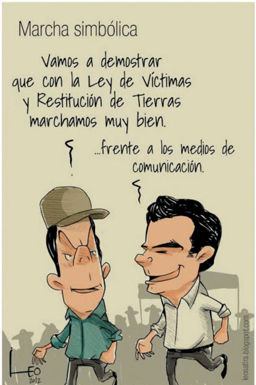
Caricatura Leo Año 2012 Revista SEMANA.com

nistrativa (más expedita), y los jueces de tierras defienden causas individuales y no colectivas (como han recomendado los expertos), surgió un “carrusel de abogados” para apropiarse de baldíos, como lo denunció la Superintendencia de Notariado y Registro. A este paso, a los reclamantes no les quedará ni un pedazo de tierra para caer muertos. Pero el presidente podrá ir tranquilo a la tumba porque sacó adelante la ley de tierras, como lo anunció en febrero de 2012, recién inaugurada su política pública RJ