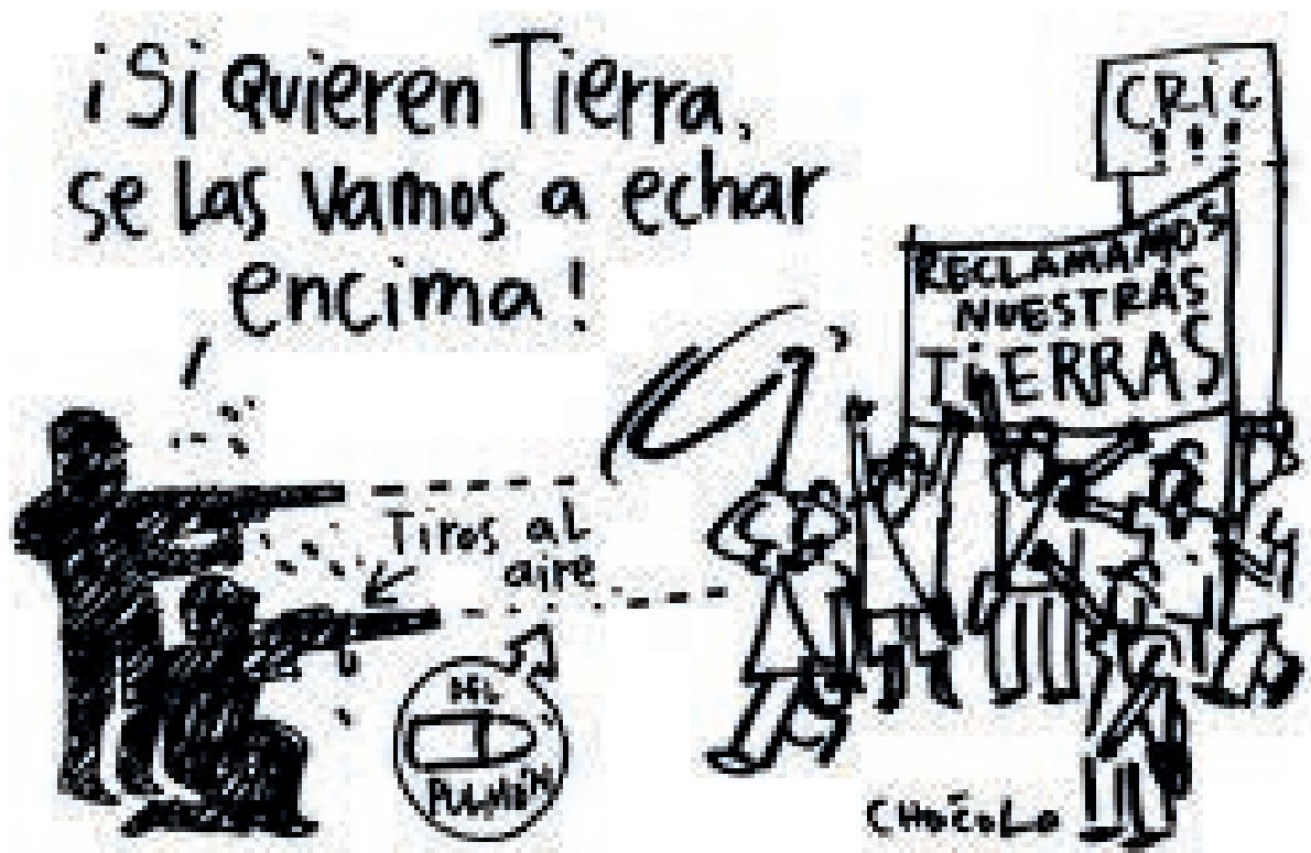
Caricatura Chócolo EL ESPECTADOR

EN EL ESPECTADOR , CHÓCOLO ha sido el más puntilloso con el tema mostrando los intereses políticos de todos los bandos frente a la Ley. En una pieza, Uribe Vélez le reclama al gobierno de Santos haberse dejado despojar de 40 kilómetros de mar, y este le recuerda que en los ocho años que gobernó se despojaron millones de hectáreas.